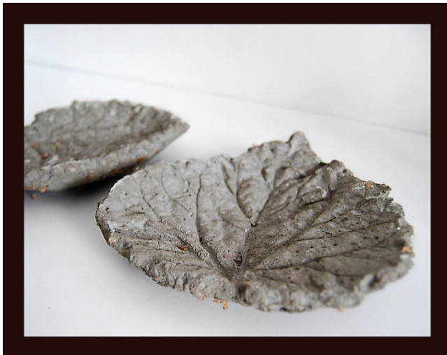
Isabella Hedstad, betongfat.